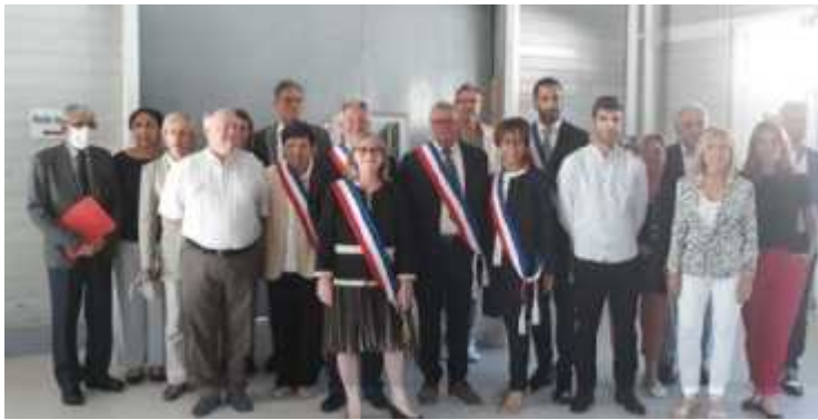
L'équipe municipale a voté son premier budget mercredi.

CONSEIL MUNICIPAL Les élus de Saint-Seurin-sur-l'Isle ont adopté le budget qui ne prévoit aucune augmentation des taux des taxes locales