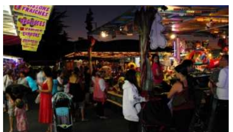
Les manèges seront présents pendant les trois jours.

Les accès ainsi que les sorties des différentes animations seront réglementés afin de respecter la santé et la sécurité de tous. Et le port du masque sera obligatoire et sans dérogation.